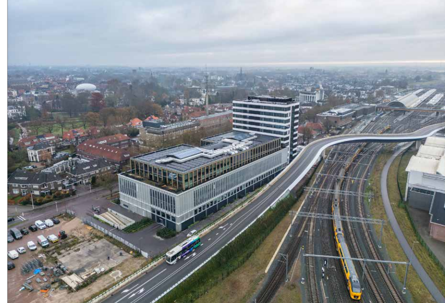
FOTO BOVEN The City Post ligt vlak naast het spoor, op de plek waar tot 1975 een haven was. De locatie en geschiedenis van het gebouw vormden de inspiratie voor het interieurontwerp.

Bureau 19 het atelier gaf het nieuwe Zwolse kantoor van APPM een interieur gericht op de toekomst, maar met respect voor het verhaal van de plek.